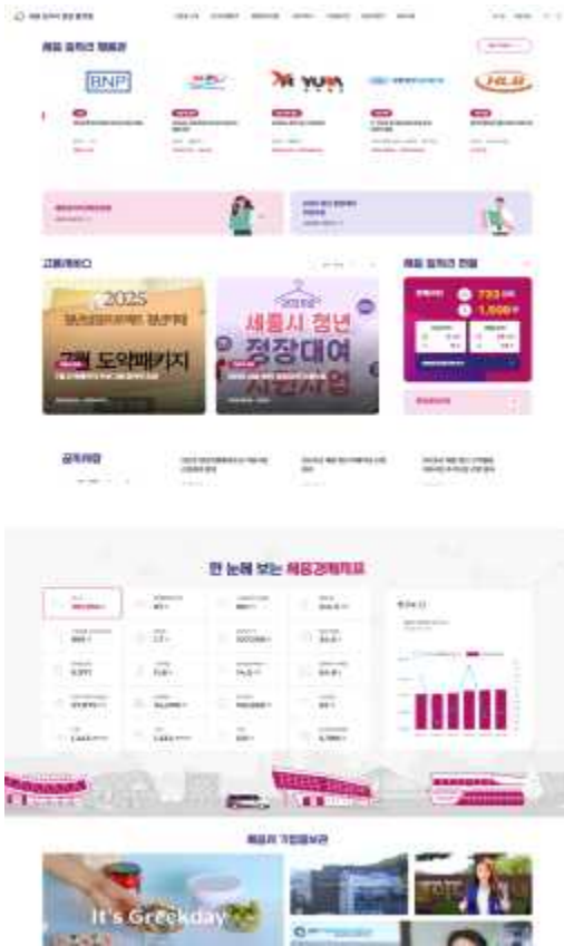
<세종 일자리 종합 플랫폼 메인시안>