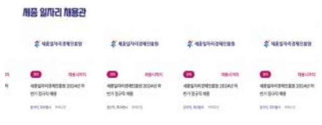
<세종 일자리 채용관(메인)>