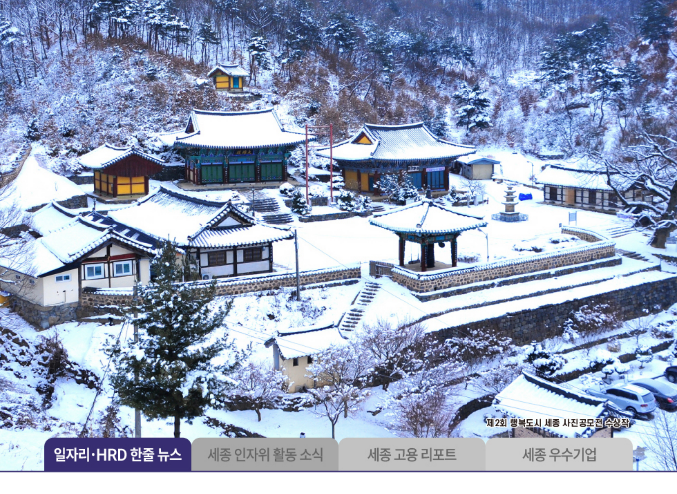
제2회 행복도시 세종 사진 공모전 수상작